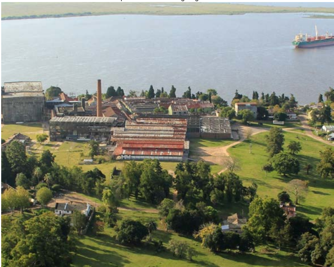
Vue aérienne du complexe industriel