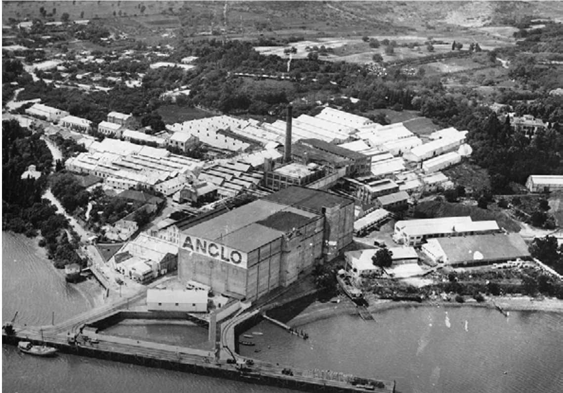
Le complexe industriel Liebig-Anglo vers 1930