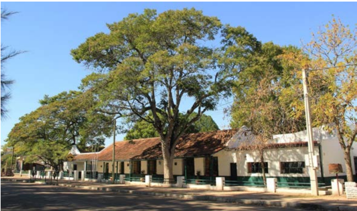
École dans le quartier de l'époque Anglo