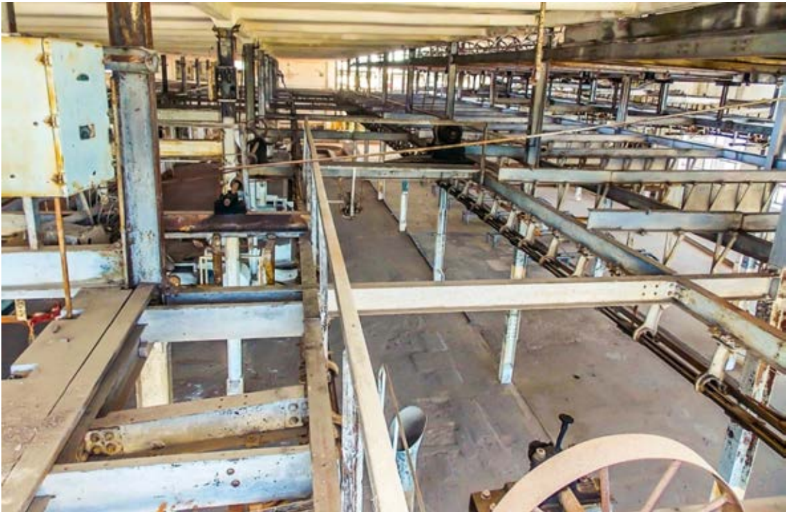
Vue de la zone de transformation de la viande